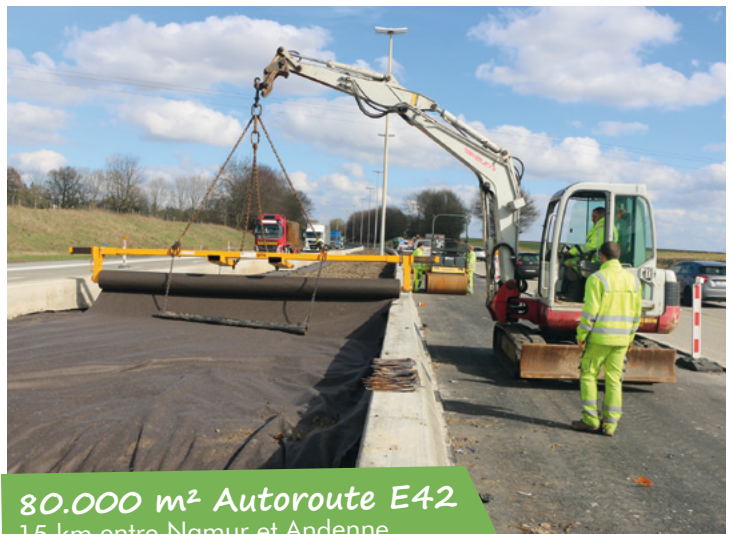
80.000 m 2 Autoroute E42 15 km entre Namur et Andenne