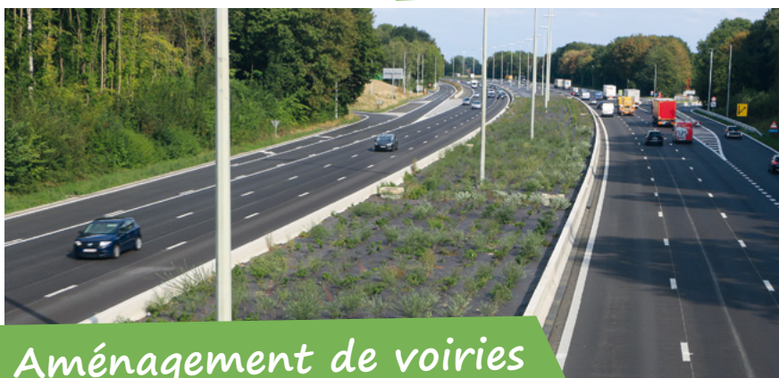
Aménagement de voiries